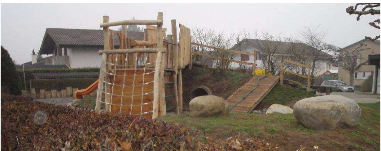
KIGA Breite umgestaltet 2010

Beim Kindergarten Breite wurde daraufhin bereits im Jahre 2010 die Neugestaltung vorgenommen. Der entsprechende Betrag war im Voranschlag 2010 eingestellt. Die dabei gemachten Erfahrungen und Erkenntnisse erlauben es, die Kosten für die jetzt zu erneuernden Anlagen besser einzuschätzen.