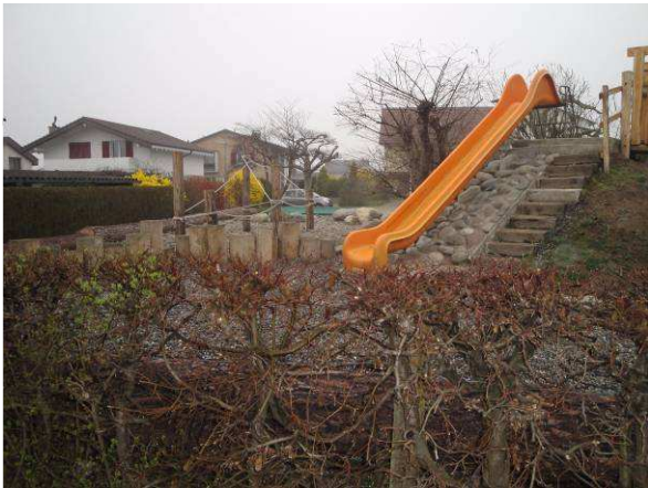
Bestehend KIGA Breite